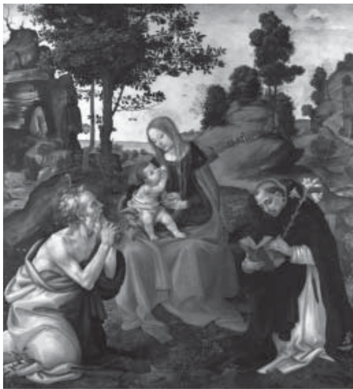
Filippino Lippi, oko 1485. Djeвица s Djetetom, sv. Jeronimom i sv. Dominikom