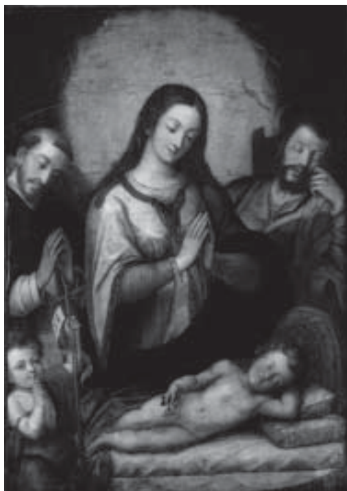
Angelino Medoro, 1576.-1631. Djevica s Djetetom s Ivanom Krstiteљem. sv. Josipom koji spava i sv. Dominikom, ulje na platnu, Sevilla