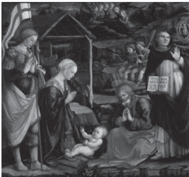
Rođenje Sv. Juraj, Sv. Vinko Fererski, Filippo Lippi, 1450.-1475.

2. Odgovor na upitnik o doprinosima nužan za izračunavanje godišnjih doprinosa entitetâ Reda. Iz odgovora se naime doznaje koliko je utrošeno za formaciju braće i kao pomoć drugim entitetima Reda, a koliko ostaje podvrgnuto doprinosu. U tu svrhu ekonom Reda poslat će svake godine upitnik, kojega model mora biti jedinstven za sve entitete.